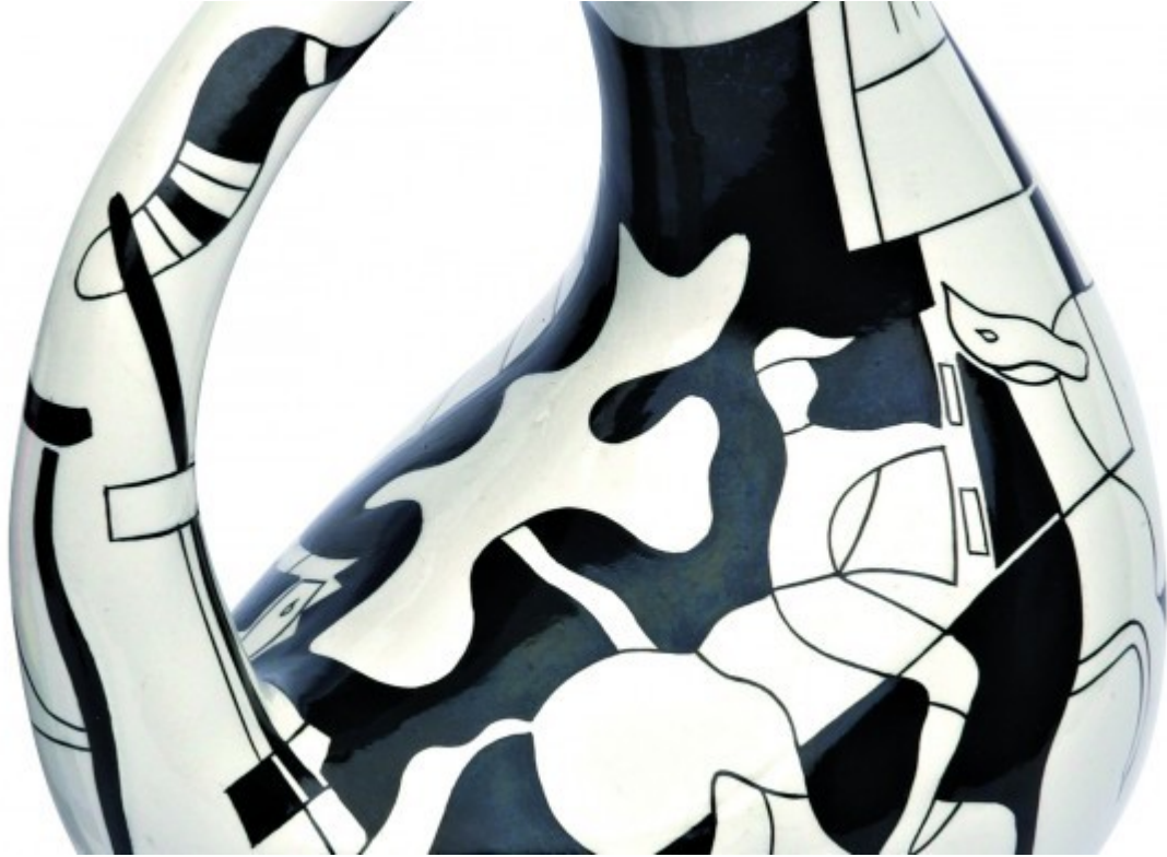
2. Brocca "C7" di Antonia Campi, 1949 (Collezione Raimondo Piras). Palazzo Morando, via Sant'Andrea 6, Milano, dal 15 marzo al 21 aprile.

Dal martedì alla domenica, dalle 9.00 alle 13.00 – dalle 14.00 alle 17.30.