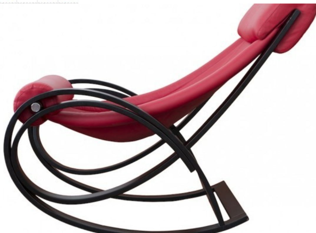
1. Poltrona “Sgarsul” di Gae Aulenti per Poltronova, 1962.