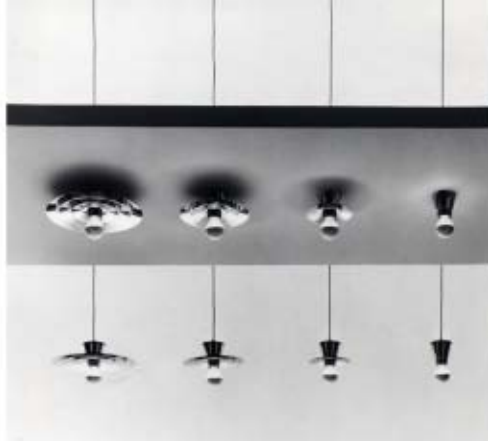
Sistema di illuminazione per SIRRAH - 1973