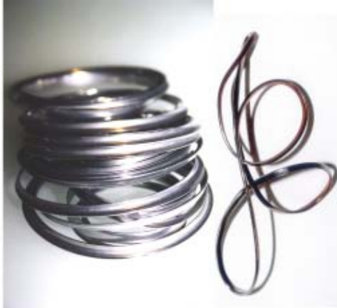
Gioielli in acciaio inox realizzati con semilavorati di ALESSI - 2003