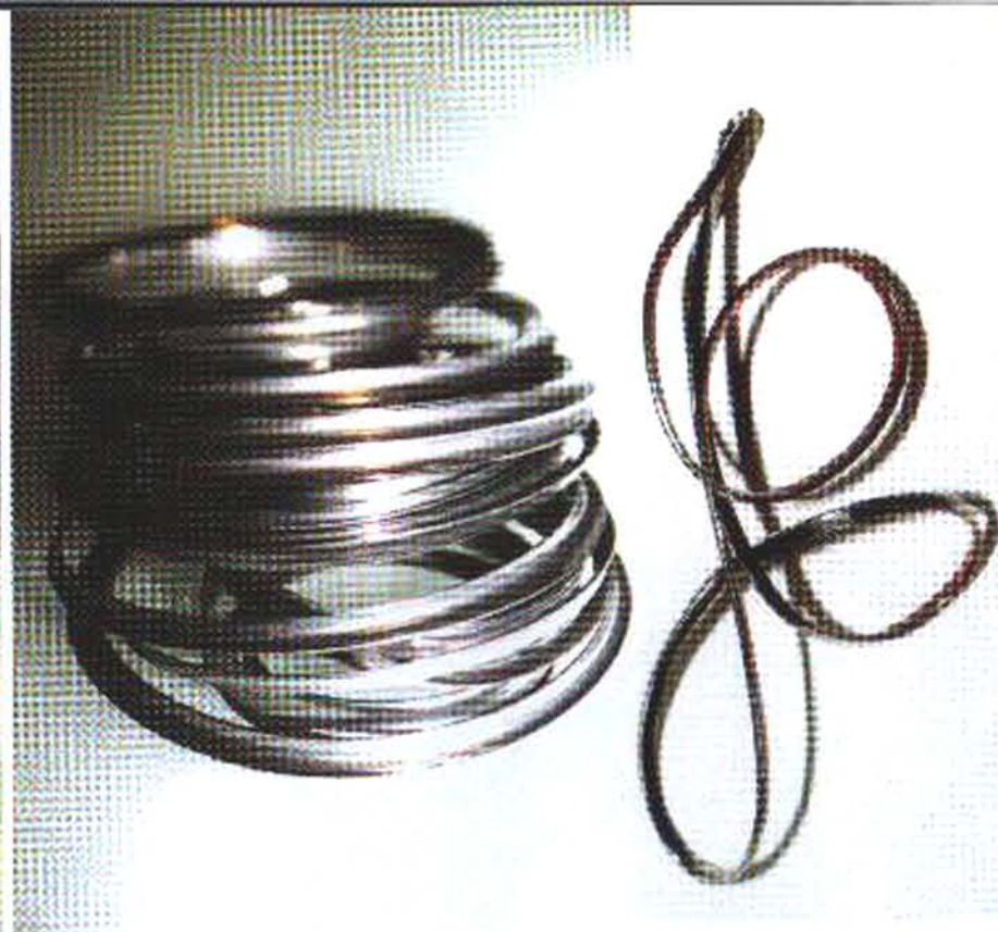
Jewels in stainless steel created with unfinished pieces by ALESSI - 2003